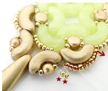
26) Placer 2 R15 et consolider, puis clôturer votre fil