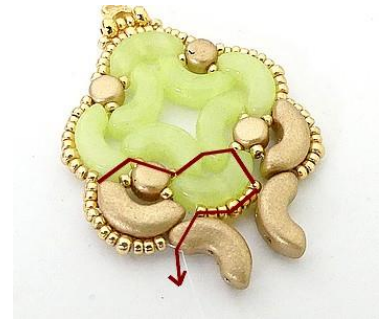
21) Puis venir se placer ICI dans l'Arcos