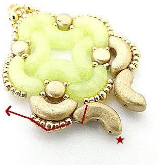
19) Placer 1 Arcos dans les rocailles