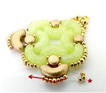
17) Placer 3 R15 dans les rocailles ICI