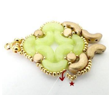
20) Placer 3 R15 dans la première R15