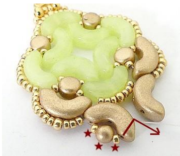
22) Placer 1 R15, 1 PR3 et 1 R15 dans l'Arcos