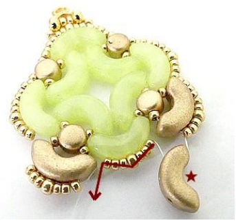
18) Placer 1 Arcos dans les rocailles