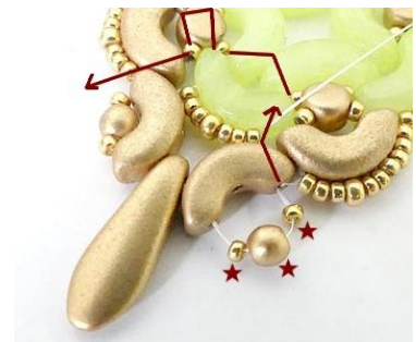
24) Répéter étape 22 et venir se placer ICI