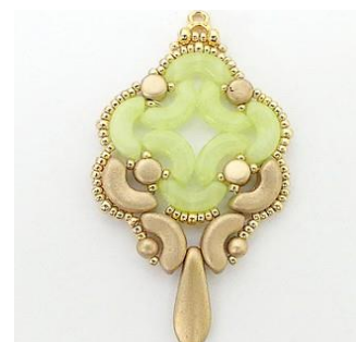
27) On obtient ceci 😊