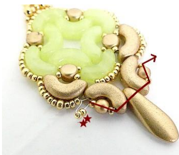
25) Placer 2 R15 et venir se placer ICI