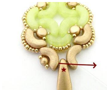
23) Placer votre Dague ou goutte