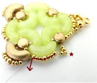
16) Placer 4 R15 dans les rocailles ICI