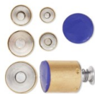
Set d'emporte-pièces Kemper Ronds x5 Réf. : OUT-163 Quantité : 1