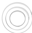
Emporte-pièce rond x3 Réf. : OUTIL-076 Quantité : 1