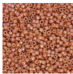
Miyuki Delica 11/0 DB2274 - Opaque Glazed Persimmon x8g Réf. : DB-2274 Quantité : 1