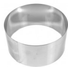
Grand emporte-pièce en inox pour modelage 80 mm - Rond Réf. : OTL-107 Quantité : 1