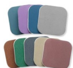
Set d'éponges abrasives Micro-Mesh x9 Réf. : OUTIL-334 Quantité : 1