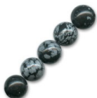
Perles rondes en pierre gemme Obsidienne Mouchetée 4 mm x20 Réf. : SP-033 Quantité : 1