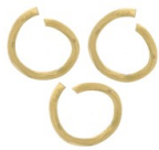
Anneaux ouverts 4x0.5 mm - Acier inoxydable 316L Doré x100 Réf. : SST-788 Quantité : 1