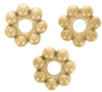
Perles rondelles fleurs 5 mm - Acier inoxydable 304L Doré x10 Réf. : STL-227 Quantité : 3