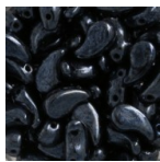
Perles en verre tchèque 2 trous Zoliduo® Left 5x8mm Jet Hematite x20 Réf. : TCHE-367 Quantité : 1