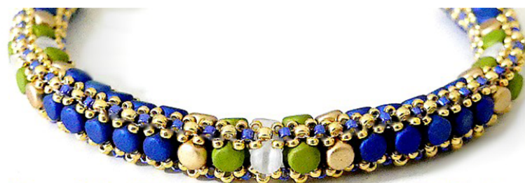
Bracelet "Michelle"© par Puca®-Paris