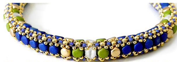
Bracelet "Michelle"© par Puca®-Paris

Kalos® Trendy Sienna Mat, Light Olive Mat, Mustard Mat et Light Gold mat