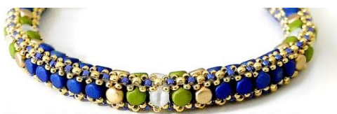
Bracelet "Michelle"© par Puca®-Paris