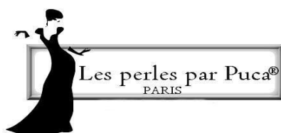
Schéma Bracelet « Michelle » © par PUCA®