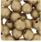
Perles rondes en bois 8 mm Doré x20 Réf. : PB-593 Quantité : 1