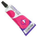
Colle à Bijoux Hasulith 30 ml Réf. : OUTIL-007 Quantité : 1