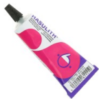
Colle à Bijoux Hasulith 30 ml Réf. : OUTIL-007 Quantité : 1