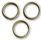
Anneaux doubles 8x0.7 mm bronze x50 Réf. : OAC-426 Quantité : 1