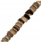
Perles rondelles Heishi en bois brut 6 mm Marron x38 cm Réf. : PB-686 Quantité : 1