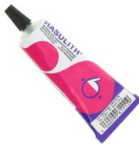
Colle à Bijoux Hasulith 30 ml Réf. : OUTIL-007 Quantité : 1