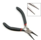
Pince ronde Eco Réf. : OUTIL-031 Quantité : 1