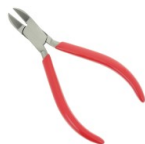
Pince coupante Réf. : OUTIL-469 Quantité : 1