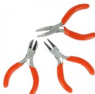
Kit de 3 mini pinces dans un pochon imitation toile de jute Réf. : OUT-918 Quantité : 1