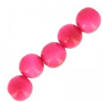
Perles rondes de Tagua 5 mm Fuchsia x 8 Réf. : TAGU-089 Quantité : 1