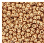
Rocaille Miyuki Duracoat 8/0 4203 - Galvanized Yellow Gold x8g Réf. : MR08/4203 Quantité : 2