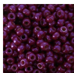
Rocaille Miyuki 8/0 4845 - Opaque Fuchsia Luster x8g Réf. : MR08/4845 Quantité : 1