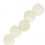
Perles rondes de Tagua 5 mm Naturel x 8 Réf. : TAGU-083 Quantité : 1