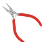
Pince plate bouts courts Réf. : OUTIL-467 Quantité : 1