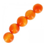
Perles rondes de Tagua 5 mm Orange x 8 Réf. : TAGU-085 Quantité : 1