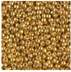
Rocaille Miyuki Duracoat 11/0 4202 - Galvanized Gold x8g Réf. : MR11/4202 Quantité : 1