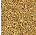
Rocaille Miyuki Duracoat 15/0 4202 - Galvanized Gold x8g Réf. : MR15/4202 Quantité : 1