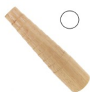
Triboulet à forger en bois rond pour bracelet x1 Réf. : TECH-448 Quantité : 1