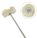
Brossette circulaire de polissage en peau de chamois 22 mm x1 Réf. : TECH-759 Quantité : 1