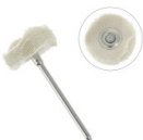
Brossette circulaire de polissage en flanelle 21x6 mm x1 Réf. : TECH-758 Quantité : 1