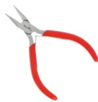
Pince plate bouts courts Réf. : OUTIL-467 Quantité : 1