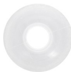
Bobine pour Kumihimo x1 Réf. : OUTIL-732 Quantité : 8