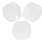
Facettes 3 mm Chalkwhite Ceramic Look x50 Réf. : FAC-927 Quantité : 1