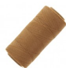
Bobine de fil ciré Linhasita pour micro macramé 0.5 mm Cinnamon (Palha) x335m Réf. : FIO-002 Quantité : 1