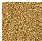
Rocaille Miyuki Duracoat 15/0 4202 - Galvanized Gold x8g Réf. : MR15/4202 Quantité : 1