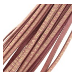
Lacet cuir La vie est belle 5 mm Rose - Doré x30cm Réf. : FILC-105 Quantité : 1