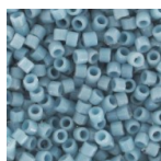
Miyuki Delica 11/0 DB2129 - Duracoat Opaque Moody Blue x8g Réf. : DB-2129 Quantité : 1