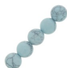
Perles rondes 4 mm imitation Howlite teintées- Bleu clair x30 Réf. : GEM-507 Quantité : 2