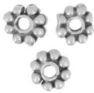
Perles rondelles fleur 6 mm - Argenté vieilli x10 Réf. : MET-029 Quantité : 1