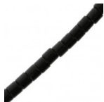
Perles tubes 4x4 mm imitation Howlite teintées - Noir x38cm Réf. : SP-836 Quantité : 1