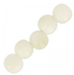
Perles rondes de Tagua 5 mm Naturel x 8 Réf. : TAGU-083 Quantité : 1