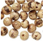
Graines açaï du Brésil 10 mm Naturel x 10 Réf. : PB-638 Quantité : 1