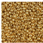
Rocaille Miyuki Duracoat 11/0 4202 - Galvanized Gold x8g Réf. : MR11/4202 Quantité : 1