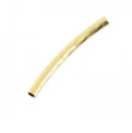
Tube gravé 25x2 mm doré x5 Réf. : MTL-807 Quantité : 2