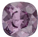
Cabochon PureCrystal 4470 12 mm Iris x1 Réf. : WST-230 Quantité : 2