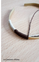
Etape 3 : Prenez le troisième fil de broderie, ici le bronze, et toujours par-dessus les deux autres fils, poursuivez le tissage.