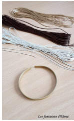
Etape 1 : Prenez le bracelet en laiton et commencez à tresser l'un des fils de broderie, ici le fil argenté.