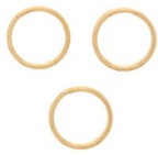
Anneaux doubles 8x0.7 mm doré x50 Réf. : OAC-398 Quantité : 1