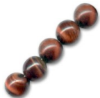
Perles rondes en pierre gemme Oeil de taureau 4 mm x20 Réf. : SP-135 Quantité : 2