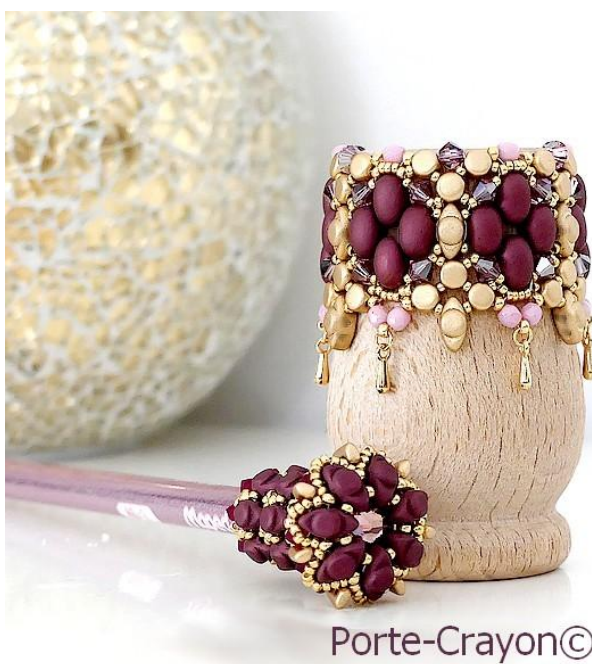
Porte-Crayon© par Puca®