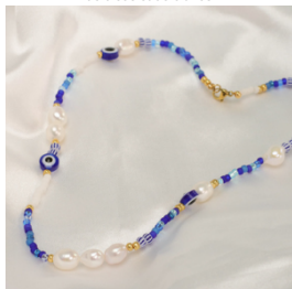
Collier bleu et blanc : un classique intemporel pour un bijou facile à assortir avec un look estival.

Notre conseil d'expert : si vous souhaitez des couleurs qui tiennent et résistent à l'été, favorisez des teintes Duracoat, qui sont plus durables.