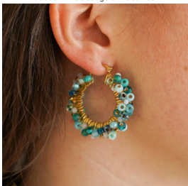
Créoles perlées en rocailles : pour celles et ceux qui veulent ajouter une touche marine à leurs boucles d'oreilles.