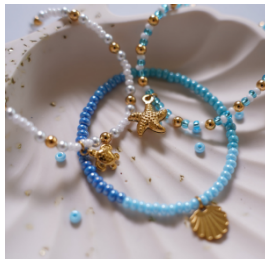
Bracelets marins en perles de rocaille : idéal pour mettre en pratique vos associations de bleus et de blancs.