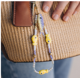
Porte-clés avec pendentif poisson en perles de rocailles : un accessoire ludique et rapide à réaliser, parfait pour découvrir le tissage en rocailles.

Vous avez désormais toutes les couleurs en main, place à la pratique ! Voici une sélection de tutoriels pour vous lancer :