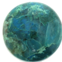
Perles heishi en pierre Chrysocolle