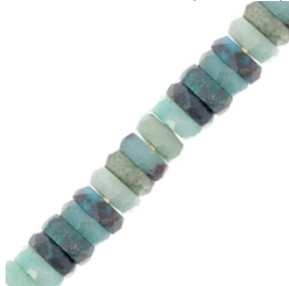
Pendentif chrysocolle en argent 925