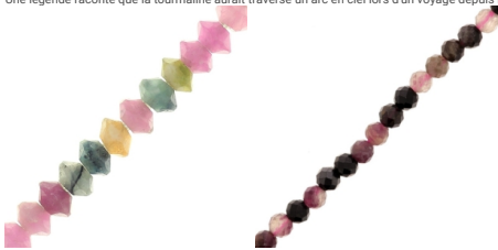
Perles rondelles boulières facettées en tourmaline