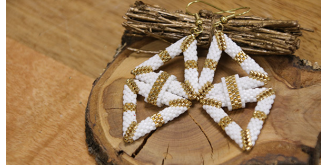
Boucles d'oreilles triangles éolidées en perles

Vous pensez avoir enfin tout vu et compris sur le Peyote Circulaire ? Et bien non... Il y a tellement de possibilités qu'en faire le tour vous prendra probablement des décennies ! Parmi les créations en Peyote 3D, il y a aussi les formes en volume, mais éolidées. Voici quelques exemples :